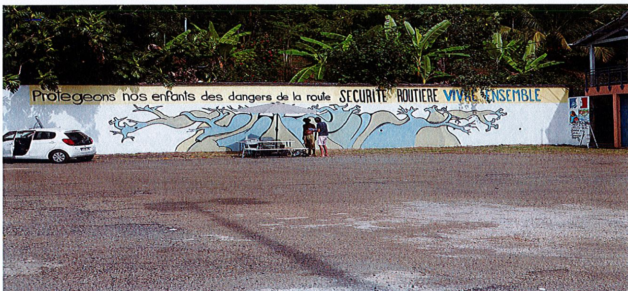
Fresque murale de l'association Mila Istawi